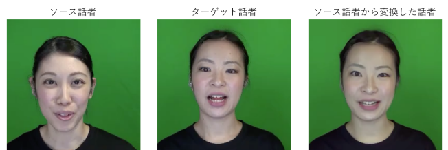
顔映像と音声の他者への同時変換

上記以外にも情報セキュリティやプライバシー保護に係わる要素技術やシステム技術の研究に取り組んでいます。