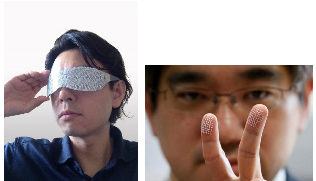
顔検出を防止する PrivacyVisor®と 写真からの指紋復元を防止する BiometricJammer

生体認証が普及し、パソコンやスマートフォンといった個人用デバイスにも生体認証の導入が進んでいます。一方でデジタルカメラなどに搭載される光学センサの進化により、生体情報を遠隔から撮影し不正に利用される可能性が指摘されています。本研究では現実空間における生体認証の利便性を確保しながら、遠隔からの生体情報の取得や、サイバー空間における生体情報の流通を、本人の意思に応じて制御可能な技術を研究しています。