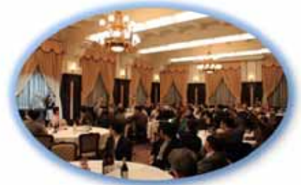
前回 NTCIR カンファレンスの様子